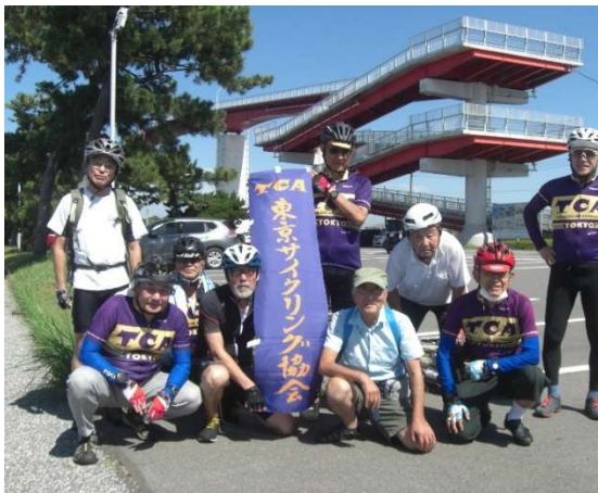
スタート 鳥居崎海浜公園 にて

当日は 30℃ 超えの真夏日でした。熱中症に気をつけ、随所で休憩しながら富津岬コースを完走しました。