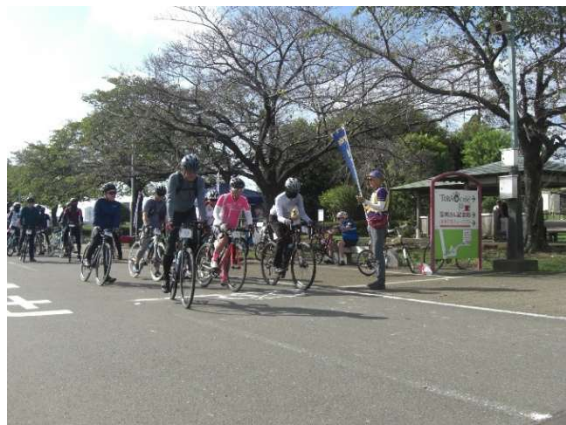
和やかで緩やかな 時間差の出走風景

ご参加くださったサイクリストのみなさま、早朝よりお手伝いいただいたスタッフの方々に心より感謝申し上げます。