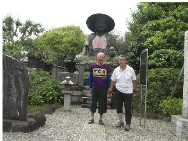
霊巖寺の境内 地蔵菩薩像の前で